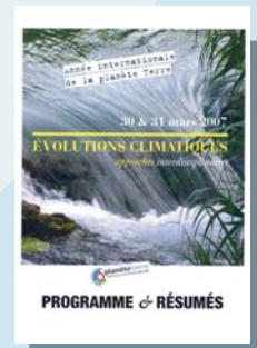
Ouvrage Evolutions climatiques