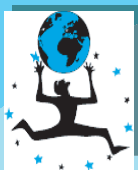
FIG 2007 Saint-Dié

La date limite de dépôt des dossiers de candidatures est fixée au 15 novembre.