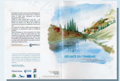
Couverture Livret Lacs Chablais