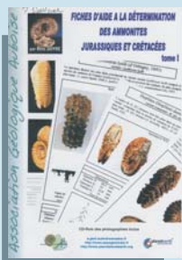
Ouvrage fossiles albiens